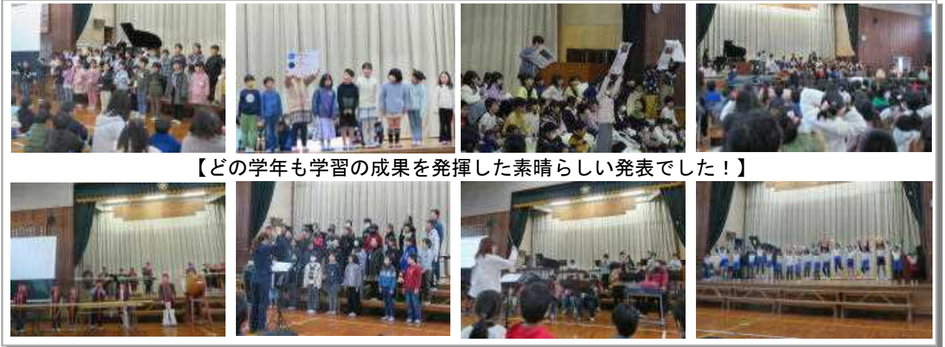
【どの学年も学習の成果を発揮した素晴らしい発表でした!】

午前の発表タイムは本校児童の学習発表だけでなく、神興幼稚園園児や福津市民吹奏楽団with福間東中吹奏楽部の皆さんの発表など、幅広い年代の方の発表を実施できました。どの発表も練習の成果が十分に発揮された素晴らしいものでした。