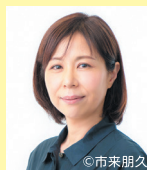
小説家 椰月 美智子