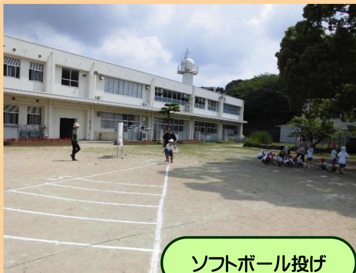
ソフトボール投げ