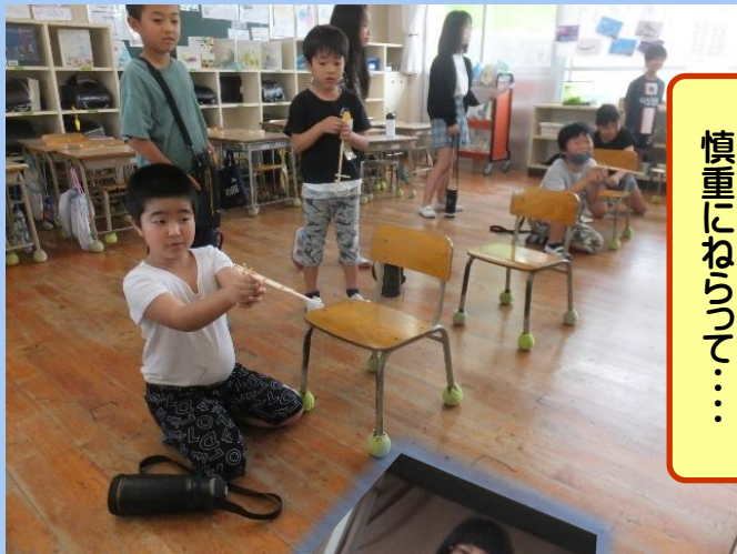
慎重にむらりて・・・