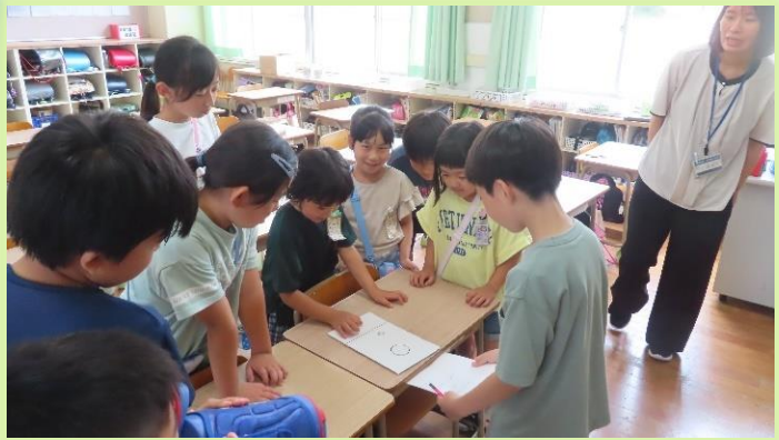
おはじきを指ではじいて、 枠に入れるのに、大苦戦！