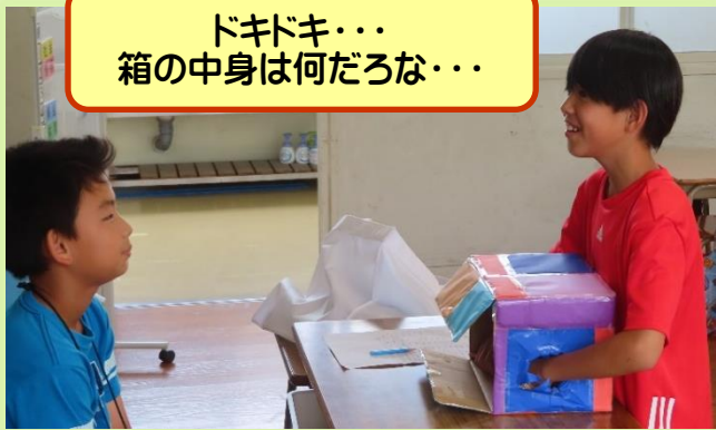
ドキドキ・・・ 箱の中身は何だろな・・・