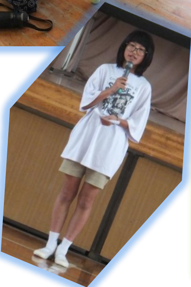
企画委員会代表あいさつ