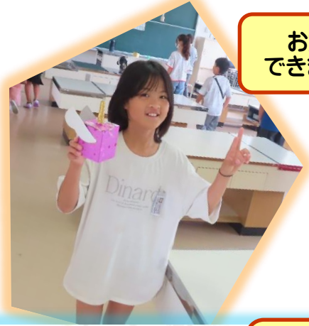
お宝ゲット できました～♪