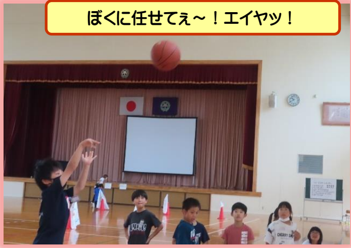
ぼくに任せてえ～！エイヤツ！