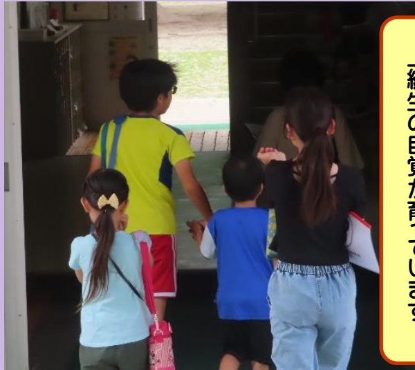
一年生の手を引く六年生。 上級生の自覚が育っています。