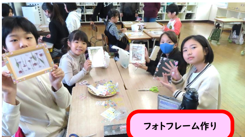
フォトフレーム作り