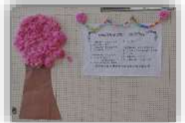
歓迎集会 プログラム

校内遠足では、学年ごとに過ごす時間と縦割り班でのお弁当タイムを行いました。お弁当の準備、ありがとうございました。「校内遠足ならではの」楽しみ方ができたと思います。笑顔の子供達の姿を見ると、とてもうれしくなります。笑顔がいっぱいの上西郷小学校は素敵です。