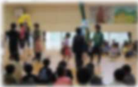
花のアーチで1年入場