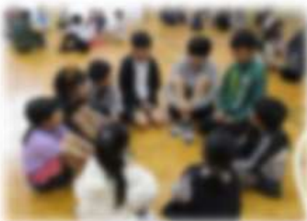
縦割り班でのゲーム