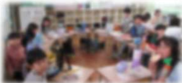
縦割り班でのお弁当タイム。おいしいね！