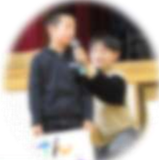
一人ずつ名前カードで自己紹介。