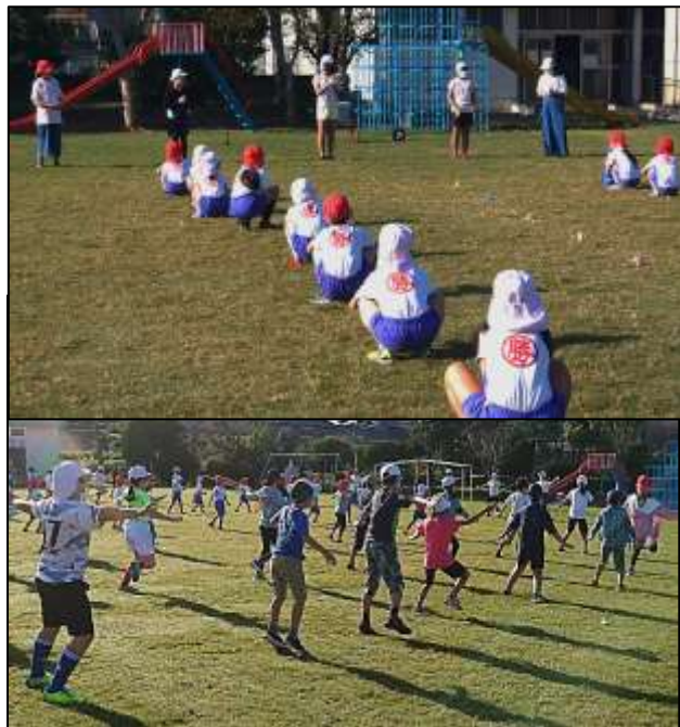
6年生の指導で進むキッズソーランの練習

令和2年度の運動会は、①休校で無くなった授業時数確保、②感染予防による教育活動制限、③多数の人が密接に集合しないために、昨年まで行っていた種目や内容の実施が難しくなりました。しかし、地域と協働した行事は、勝浦小の特長であり、感染リスクを最大限に抑える工夫を行い勝浦郷づくりと協働で「マル勝まつり」と「勝浦大運動会」を合わせた行事を11月14日(土)の午前(8:45~12:30)に運動場で行うことになりました。