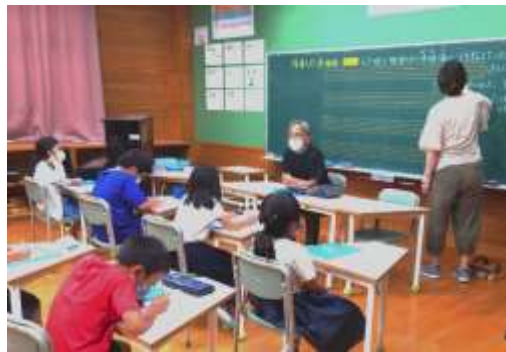
浄瑠璃保存会の話真剣に聞く3年生

また、勝浦小の特長である異学年で行う活動では、4・5・6年で行う委員会活動をはじめ、ふるさと学習や教科学習の成果発表として、他学年へ披露や伝える活動を行っています。