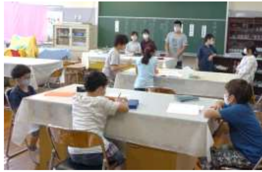
6年生のリーダーシップで進む委員会活動