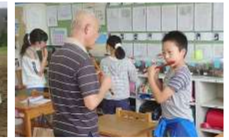
地域指導者にしの笛を習う5・6年生