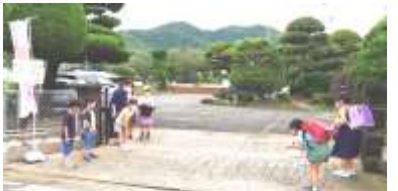
委員会活動に発展したあいさつ活動

この5つのスキルを本年度の重点目標である「地域と共働し、自ら考え行動する子ども」をめざす教育活動で育てて行きたいと考えています。具体的には、「地域と共働する活動」を通して『ネットワーク構築力』を、「自ら考え行動する」ことで、『仮説思考力』や『自己変革力』を、ICTの活用や学びの過程を通じて『テクノロジーの理解と情報収集力』『学び続ける力』をめざします。「おはよう Tuesday」のあいさつや自学ノートの取り組みもスキルを育てる大事な取り組みになっています。