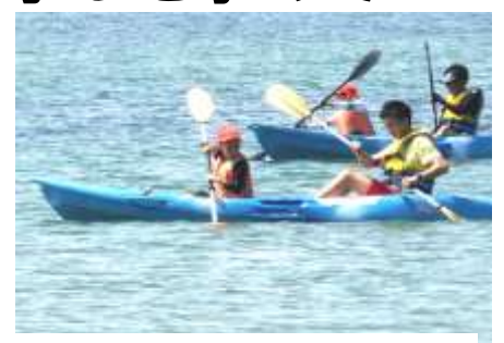
勝浦海岸で海のよさを味わう4年生