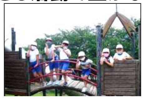
あんずの里で公園探検を行う1・2年生

5・6年生は朝活・総合的な学習で獅子楽の学習を地域指導者の支援で行い、伝統文化のよさを感じ取っていました。勝浦小のよさである歌唱表現を伸ばす「かつ音」は、フェイスシールドを付け、距離を取り、全校を二つに分けて新しい曲に挑戦しています。これからも工夫しながら、今まで勝浦小学校で大切にしてきたものをつなぎ、育てていきたいと思ひます。