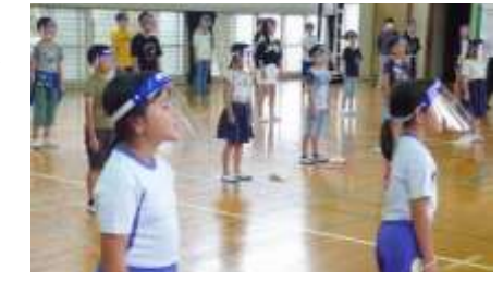
かつ音、フェイスシールドで歌う子どもたち