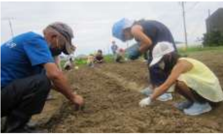
畑で大豆の種を植える3年生