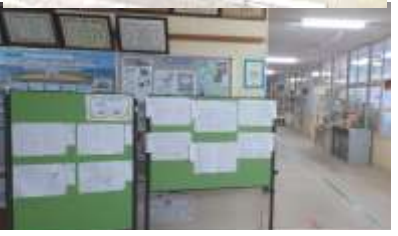
仮説検証も見られた自学ノートの掲示