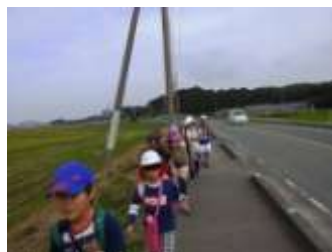
行きがけの縦割りグループ いつも歩いているから大丈夫!

やがて、みんな6年生になります。そのときには、今の6年生のようにリーダー性と思いやりを発揮してくれることだと思います。今は「してもらう」立場ですが「してあげる」立場になります。人は立場によって変わり成長する、とよく言われますが、小学生でも同様なことが言えます。これからが楽しみです。