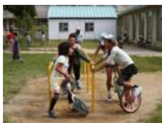
津小の子ども達と楽しそうに 交流しています。