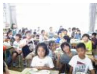
クラスに入って一緒に食事。 勝浦の子を探るのが大変です。