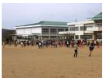
運動場に出て、クラスごとにみ んなで遊びました。