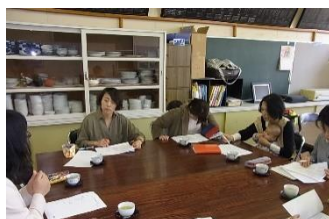
地域コーディネーターとの打ち合わせ

上記ふたつは地域学習の一例ですが、これから先、獅子楽、人形浄瑠璃、みそづくり、新原・奴山古墳群の学習など様々な学習が進んでいきます。このような学習を継続し発展させることに一役買っていたいのが「地域コーディネーター」と「マル勝サポーター」です。地域や保護者の方々から勝浦小の学習に魅力をもち、地域での学びを存続させていくことは地域一体となった学校づくりを推進する上で最も大切なことと考えています。先日、本年度の地域学習の計画を立てるために地域コーディネーターの方々にご足労いただき、話し合いを行いました。勝浦小の学校行事や教育活動は多く、地域・保護者の皆様方にはご負担をおかけすることも多々あるかと思ひますが、できる限り学校に足を運んでいただきますことをお願いいたします。