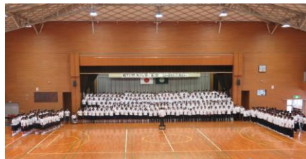
全校合唱(津屋崎中)