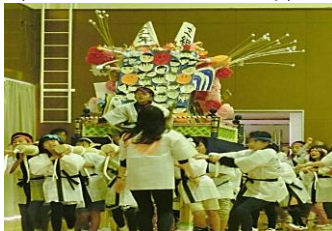
子ども山笠(津屋崎小)