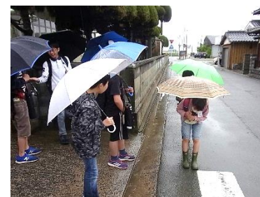
傘をさして「おはよう」の挨拶

「おはよう Tuesday」は、数年前、津中ブロックPTAとして取り組み始めた活動です。勝小では、昨年度から6年生（現中一）が積極的に取り組みはじめ、今の6年生がそれを見て受け継いでいます。この活動に関して、私は「取り組みなさい。」とは一言も言っていません。ただ、必ず私も毎日校門に立つよう心掛けています。