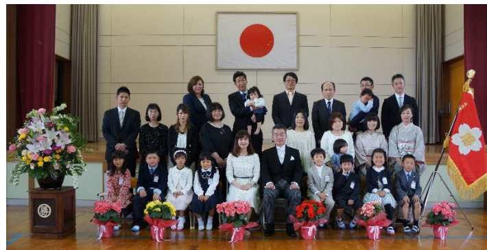
入学式後、少し緊張がとけた5枚目の写真です。

それまで私たち大人は、手を差しのべるだけではなく、「見守ること」「子ども達の力を信じること」「任せること」が必要なのではないかと思います。