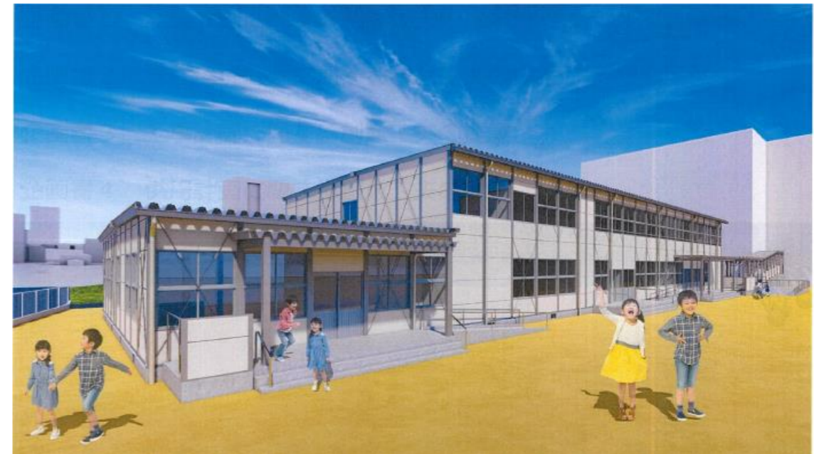
【完成イメージパース】

工事名称 : 福間小学校増築校舎賃貸借工事 発注者 : 福津市教育委員会 教育総務課 施工業者 : 大和リース株式会社 福岡支社 工事期間(予定) : 令和5年5月中旬 ~ 令和5年9月 連絡先 : (092)751-5058 (大和リース株式会社 福岡支社)