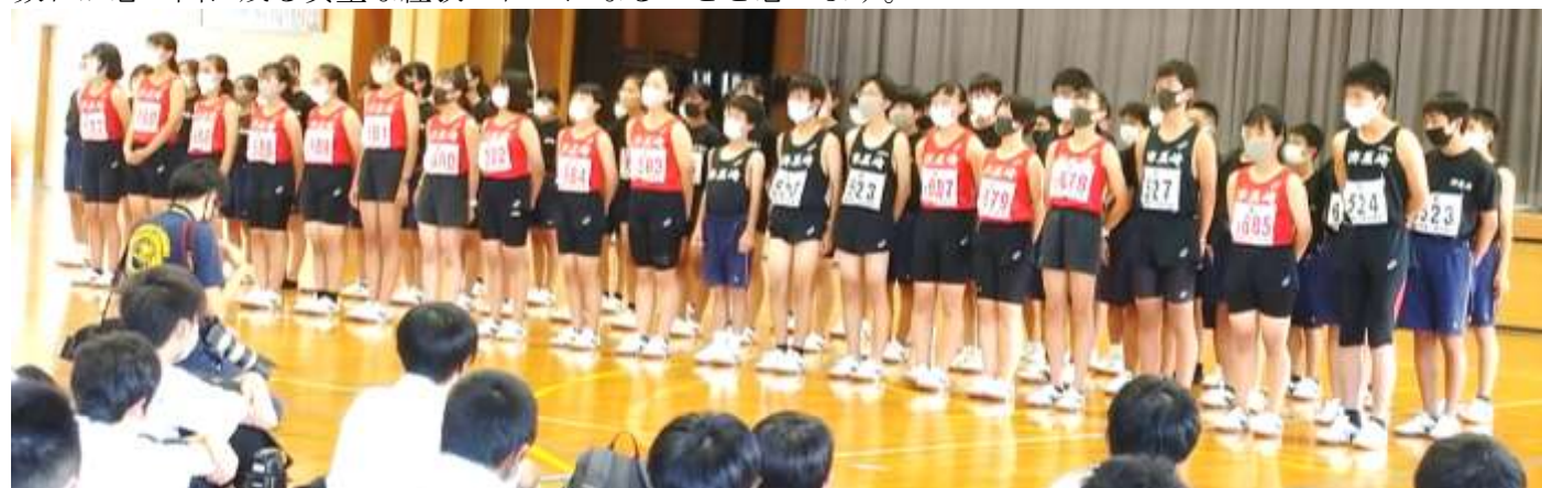
【 部活動激励会 陸上部の紹介 】

本校の生徒は、あいさつの様子を見ても、受け答えや顔つきを見ても、一人一人、人としての良さや素晴らしさを感じることが、多々あります。3年生にとってはもちろんですが、1・2年生にとっても、これからの数日が思い出に残る貴重な経験の日々になることと思います。