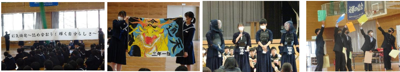
「生徒会テーマ発表」 「学級旗披露」 「部活動紹介」 「ブロック抽選」

4月13日(木)に、入学したばかりの1年生と2・3年生の対面式・部活動紹介を行いました。対面式では、歓迎の言葉と誓いの言葉、生徒会テーマ『彩気煥発～認め合おう！輝く自分らしさ～』の発表、生徒会活動の紹介など、部活動紹介はそれぞれの部活のパフォーマンスを交えた活動の紹介がありました。また、体育祭に向けてのブロック決めもあり、とても盛り上がりました。1年生は早く津屋崎中学校のことを知り、その一員として頑張ってもらいたいと思います。